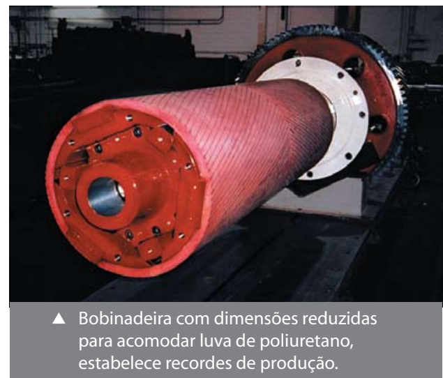
▲ Bobinadeira com dimensões reduzidas para acomodar luva de poliuretano, estabelece recordes de produção.

Estes serviços incluem a manutenção de estoques de componentes críticos para minimizar o tempo ocioso, acordos de remuneração por tonelada que garanta a atividade produtiva, a eficiência e assistência no local.