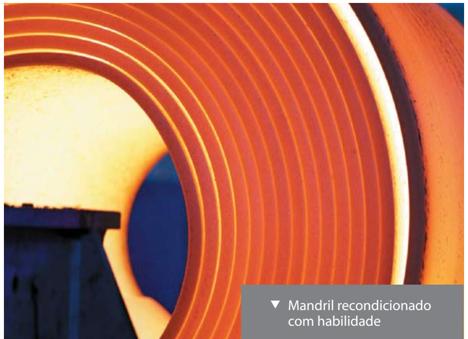
▼ Mandril reconicionado com habilidade

e reconiciona, faz a manutenção e aperfeiçoa com competência os mancais, bobinadeiras e mandris para processos de laminação a quente, a frio e de encruamento nas tolerâncias severas exigidas pelos produtores de chapas finas dos dias de hoje. Também construímos mandris e fornecemos peças sobressalentes para as aplicações a quente e a frio.