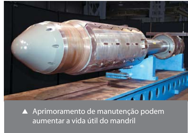
▲ Aprimoramento de manutenção podem aumentar a vida útil do mandril

Para aprimorar ainda mais nossos serviços de recondicionamento e de campo, a SMS SIEMAG SERVICES LTDA também presta serviços de valor agregado criados para ajudá-lo a manter seus mandris operando perfeitamente por longos períodos de atividade.