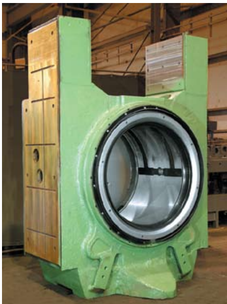
▲ Mancal reconicionado apresenta desempenho como novo

Para ajudar os produtores de aço e alumínio a alcançarem suas metas de qualidade, a SMS SIEMAG SERVICES LTDA recupera