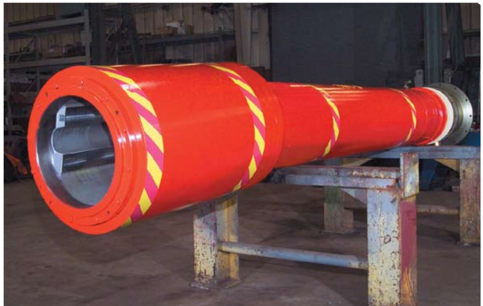
▲ Os Eixos Tubulares Lubrificados a Óleo patenteados Sieflex® reduziram os custos com manutenção

Já que a SMS SIEMAG SERVICES LTDA é a única prestadora de serviços autorizada para trabalhar com equipamentos da SMS SIEMAG na América do Sul, temos acesso pleno e aberto a todos os desenhos e aos engenheiros da SMS SIEMAG podendo garantir que os reparos sejam efetuados em plena conformidade com as especificações originais. Para garantir que os Eixos SIEFLEX® continuem operando como novos, os técnicos da SMS SIEMAG SERVICES LTDA foram treinados pelos engenheiros da SMS SIEMAG na Alemanha e EUA. Os engenheiros da SMS SIEMAG SERVICES LTDA também participaram no desenvolvimento de nossas instalações de reparos e deram amplo treinamento para os nossos técnicos.