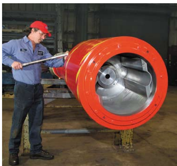
▲ A exímia manutenção melhora a confiabilidade dos eixos

Com mais de 50 engenheiros da SMS SIEMAG dedicados à divisão de unidades de acionamentos e seus componentes, podemos focar com sucesso questões operacionais e de projeto que afetam o desempenho dos eixos e oferecer soluções para uma operação econômica sem perder a qualidade.