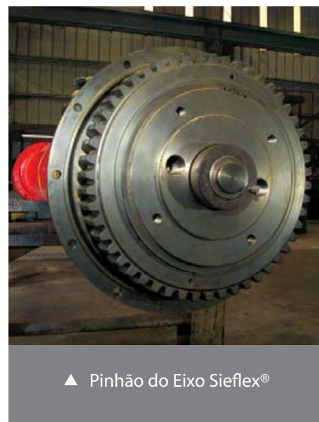
▲ Pinhão do Eixo Sieflex®

Para saber mais sobre como a SMS SIEMAG SERVICES LTDA pode ajudá-lo a reduzir os custos com manutenção, melhorar o desempenho e a confiabilidade nos eixos de acionamentos, favor entrar em contato conosco através dos contatos abaixo.